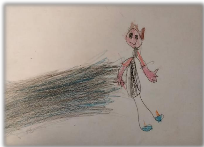
Io che scappo dai bimbi che mi rincorrono

Due sono le attuali sezioni presenti, la sezione dei coccodrilli e la sezione dei pesci, per un totale di 38 bambini. Le classi sono eterogenee per età. In ogni sezione sono presenti due insegnanti di riferimento.