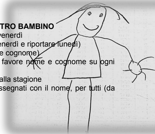
Sono io D.4 anni