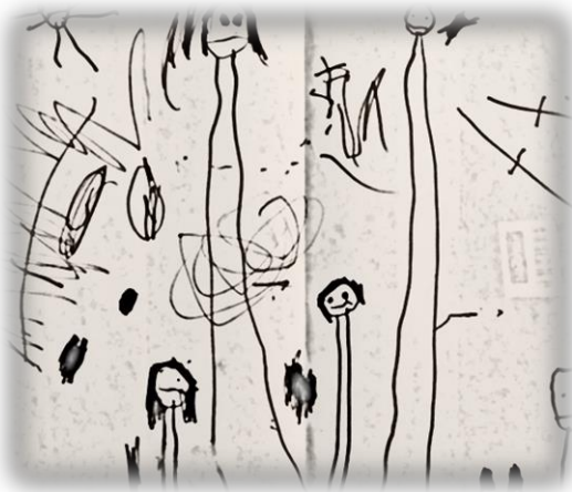
La mia famiglia