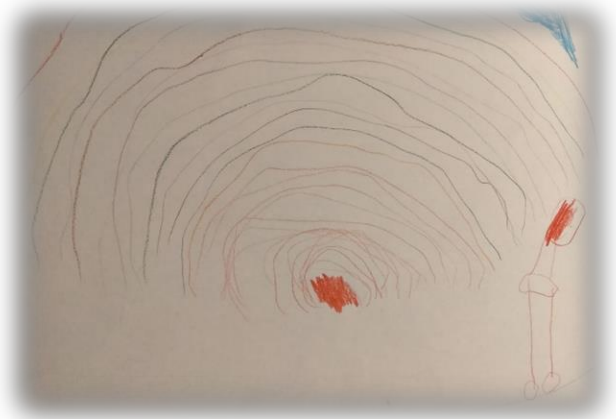
Arcobaleno e io vestito da pirata P. 4 anni